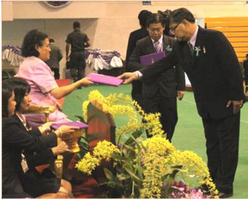
โรงเรียนเทศบาล ๕ เด่นห้า ได้รับพระราชทานป้ายงานสวนพฤกษศาสตร์โรงเรียน จากสมเด็จพระเทพรัตนราชสุดาฯ สยามบรมราชกุมารี เมื่อวันที่ ๒๑ มิถุนายน ๒๕๕๕