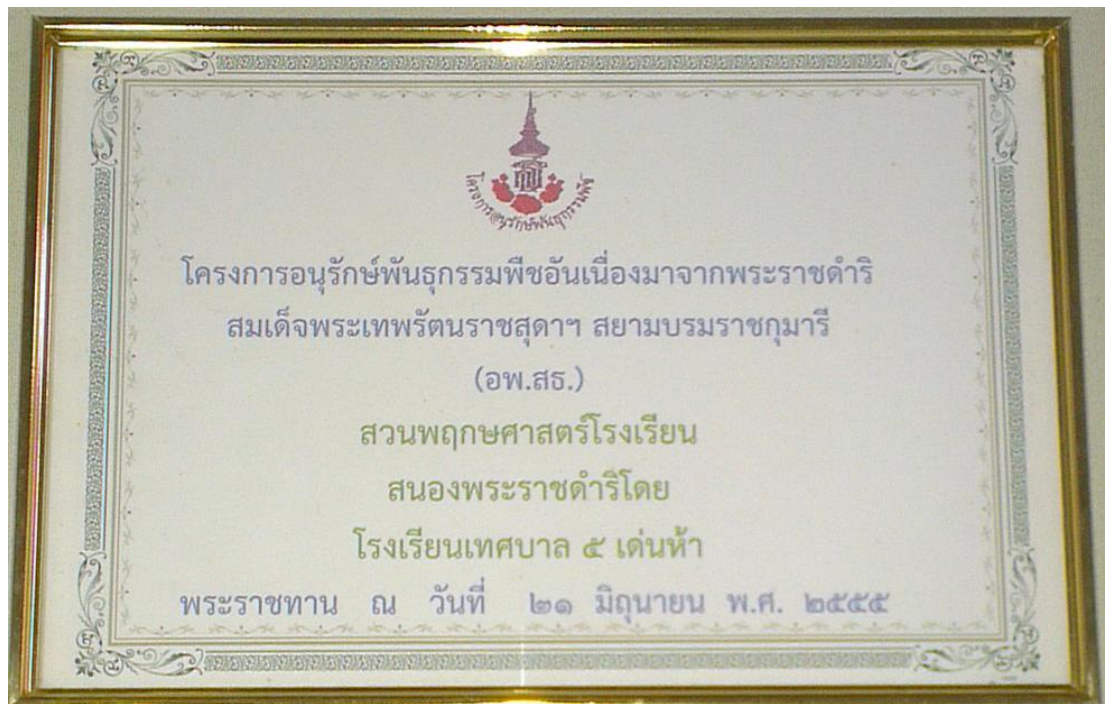
ป้ายงานสวนพฤกษศาสตร์โรงเรียน