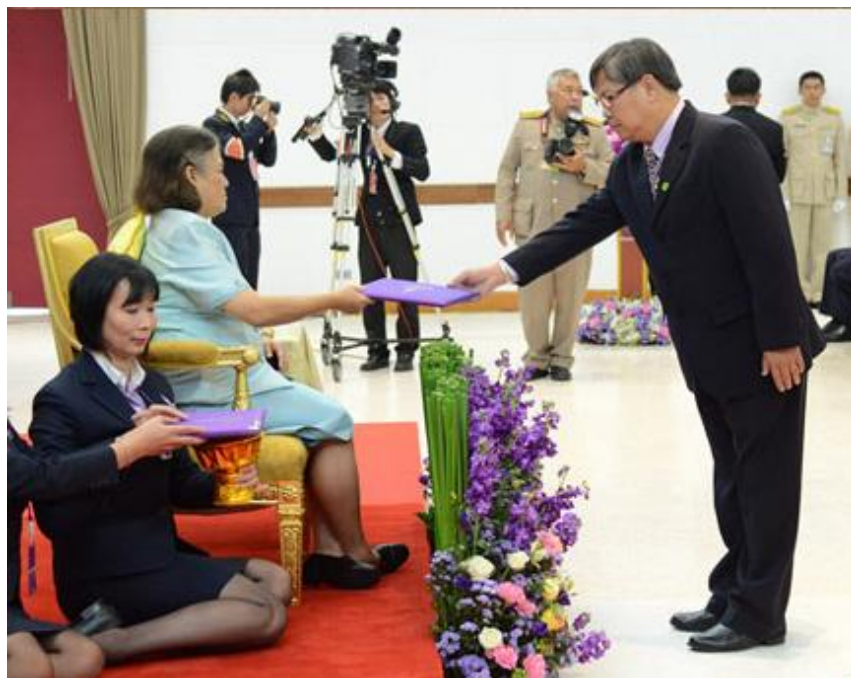
โรงเรียนเทศบาล ๕ เด่นห้า ได้รับพระราชทานเกียรติบัตรงานสวนพฤกษศาสตร์โรงเรียนชั้นที่ ๑ จากสมเด็จพระเทพรัตนราชสุดาฯ สยามบรมราชกุมารี เมื่อวันที่ ๒๐ ธันวาคม ๒๕๕๖